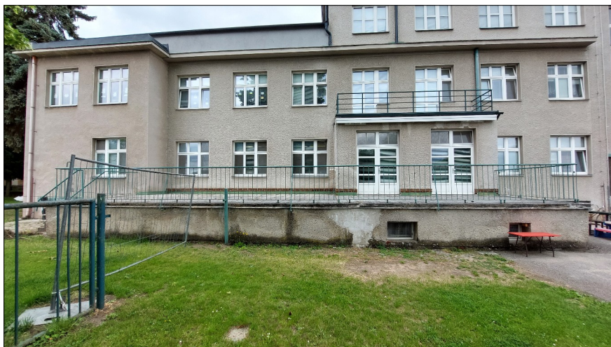
Obr.16: Příklad poškození soklu odstříkující dešťovou vodou a tajícími sněhovými návěje

Odstříkující dešťová voda a tající sněhové návěje v kombinaci se vztlínající vlhkostí v soklové části zdiva objektu způsobuje další vlhkostní namáhání objektu. Většina soklu je do různé výšky tvořena pískovcovými kvádry, mnohde je však fasáda ze škrabaného břizolitu svedena až k terénu s jasně viditelnými poškozeními vodorozpustnými solemi. Na soklovém zdivu nebyla identifikována žádná účinná ochrana proti tomuto vlhkostnímu namáhání.