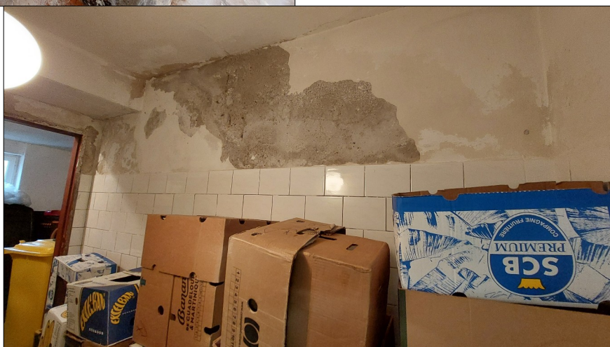
Obr.11,12: Prosakující vlhkost do suterénu a důsledky zatékání terasou

V neposlední řadě na vlhkost zdiva objektu podílí i nedostatečně odvedené dešťové vody do bezpečné vzdálenosti od objektu nebo jejich odkanalizování. Většina svodů vyúsťuje přímo na okolní terén, v jednom případě je dokonce vyveden přímo v blízkosti základového zdiva.