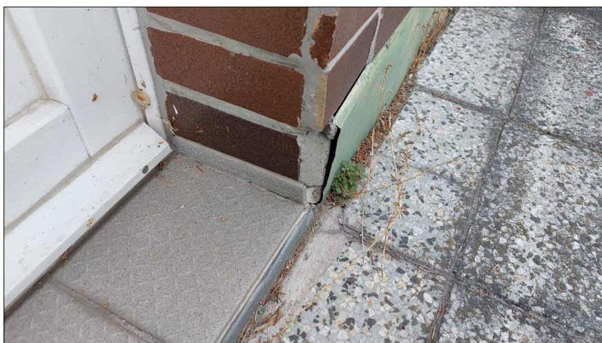
Obr.6,7: Defekty oplechování teras ve dvorním traktu.