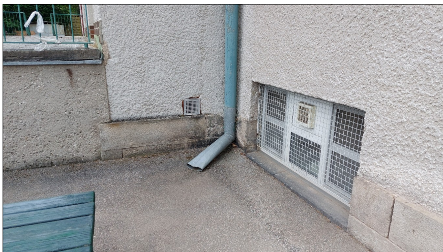
Obr.13: Běžné vyústění dešťových svodů

V neposlední řadě na vlhkost zdiva objektu podílí i nedostatečně odvedené dešťové vody do bezpečné vzdálenosti od objektu nebo jejich odkanalizování. Většina svodů vyúsťuje přímo na okolní terén, v jednom případě je dokonce vyveden přímo v blízkosti základového zdiva.