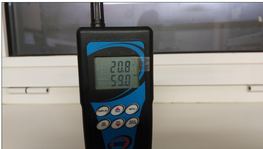
Obr.5: Relativní vlhkost vzduchu suterénu těsně pod hranicí vlhkého prostředí.