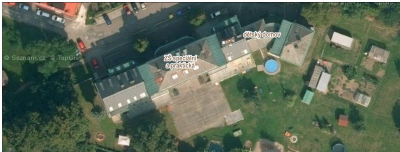
Obr.1: Letecký pohled na objekt Základní školy speciální a praktické s dětským domovem v Jaroměři (*mapové podklady Seznam.cz, a.s., OpenStreetMap, 2020)

Jedná se o zděných objekt Základní školy speciální a praktické s dětským domovem, skládající se z pěti řadově umístěných a vzájemně propojených částí, umístěných v rovině okolního terénu v severní části města, a to přibližně 200m od koryta řeky Úpy. Jádrem hlavní budovy pochází z přelomu 19. a 20.století. Většina půdorysu objektu je podsklepena, v nadzemní části jsou pak dvě až tři nadzemní podlaží a obytné podkrovní. Podlahy 1.NP jsou přibližně 1300 mm nad úrovní okolního terénu. Zdivo je smíšené, převážně z plných pálených cihel, ve spodních partiích, soklu a suterénu pak kombinované s pískovcem. Situování objektu je patrné z obr.č.1.