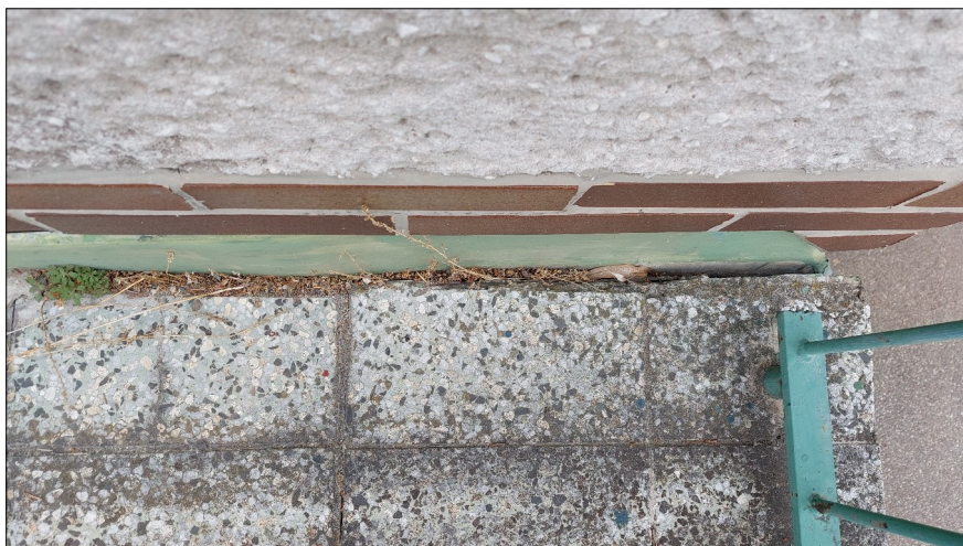
Obr.8: Netěsná dilatační spára mezi terasou a objektem