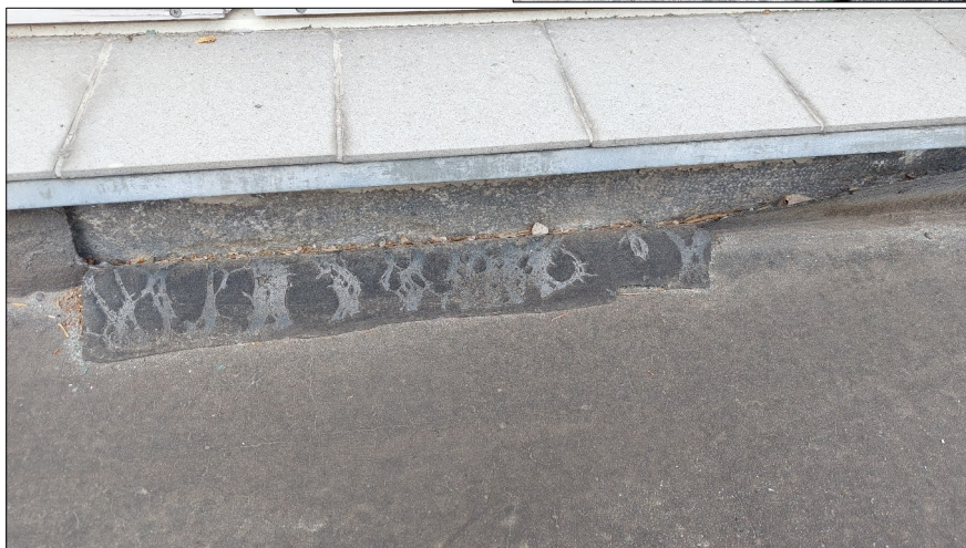
Obr.9,10: Defekty opravy dilatační spáry mezi terasou a objektem