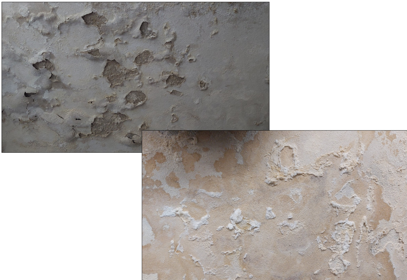
Obr.14,15: Příklady výkvětu vodorozpustných solí

Důsledkem dotace vysoké vlhkosti je pak zasolení zdiva a omítek projevující se výkvěty vodorozpustných solí, mnohde krystalizujícími na povrchu zdiva, degradací omítek, v některých částech zcela opadáných s počínající degradací zdiva.