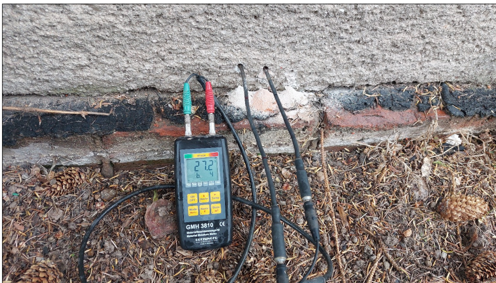
Obr.4: Velmi vysoká vlhkost zdiva nad dožitou horizontální hydroizolací zdiva v západní části objektu.

Vzlínající vlhkost, která je detekována na všech svislých konstrukcích 1.PP i 1.NP budovy objektu, kde se provádělo hloubkové měření vlhkosti, je způsobena buď chybějícími hydroizolačními opatřeními nebo dožitím a defekty stávajících původních horizontálních hydroizolací zdiva. Ty však byly při průzkumu identifikovány pouze na obvodovém zdivu západní části objektu a na dvou terasách v jižní, dvorní části objektu. Všechny však poškozené nebo dožité, umístěné v úrovni terénu bez hydroizolační ochrany soklu. U obvodového zdiva 1.PP je na všech stranách objektu vzlínající vlhkost kombinována i s prosakující vlhkostí z přilehlého terénu v souvislosti s výškovou dispozicí podlaží, jenž je většinou pod úrovní terénu.